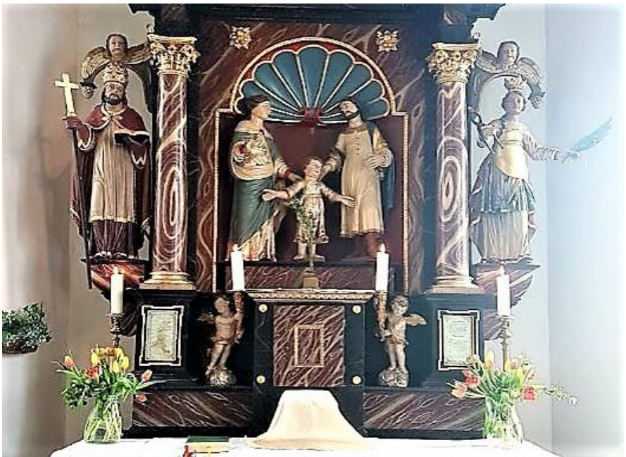
Altar in der Kirche von Brieden

Pfarreien im pastoralen Raum Treis-Karden: Kail, Karden, Lieg, Lütz, Mörsdorf, Moselkern, Müden, Pommern, Treis, Zilshausen-Petershausen - www.pg-treis-karden.de