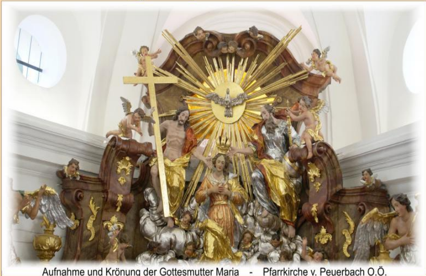
Aufnahme und Krönung der Gottesmutter Maria - Pfarrkirche v. Peuerbach O.Ö.